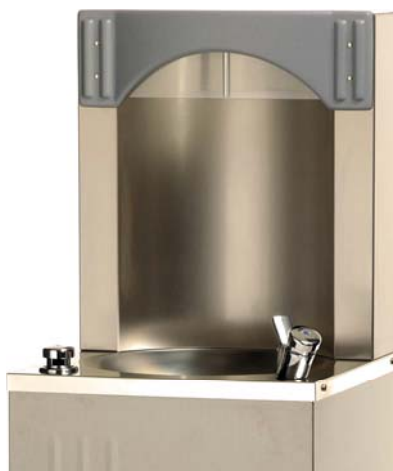
Robinet rince bouche en option