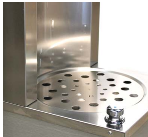
Grille de support pour carafes en option